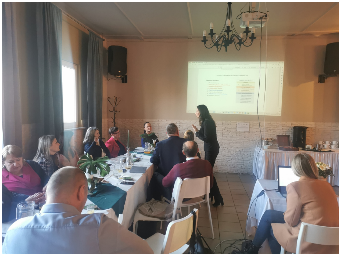
Spotkanie Kobierzyce 09.02.2023

Szóste spotkanie, które było swoistym podsumowaniem prac nad I i II obszarem merytorycznym strategii i przygotowaniem do warsztatu strategicznego odbyło się 09.02.2023, godz. 16.00 w Pizzeria Arrivo, ul. Spółdzielcza 9, w Kobierzycach. Uczestniczyło w nim osobiście 15 osób.